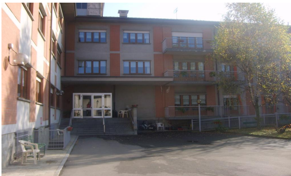
Ingresso della Casa di Riposo "G. Vada"